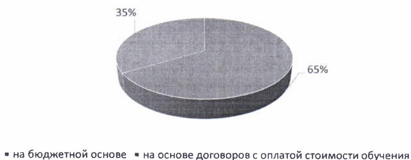
Диаграмма 1. Численный и процентный состав контингента обучающихся по основе обучения (бюджет, внебюджет) на 01.04.2018

Контингент обучающихся по заочной форме: 128 чел.